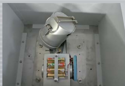
安装 300 cc 容器时